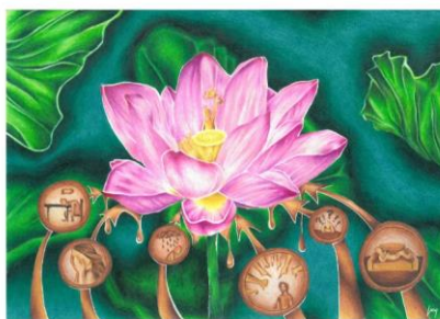
2. mesto LUCY BRINOVEC