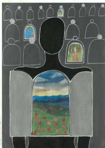
1. mesto EVA PURGAJ