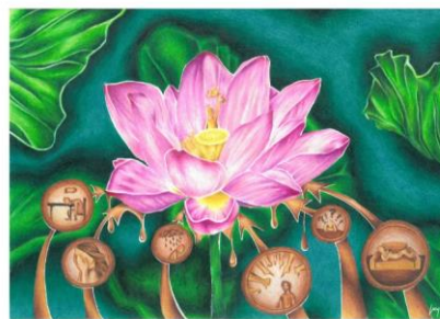
2. mesto LUCY BRINOVEC