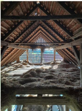
1. mesto INES BREZOVŠEK