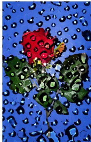
2. mesto NEVA ŠELIH